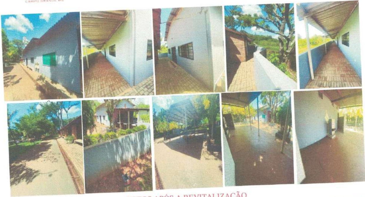
FOTOS APÓS A REVITALIZAÇÃO